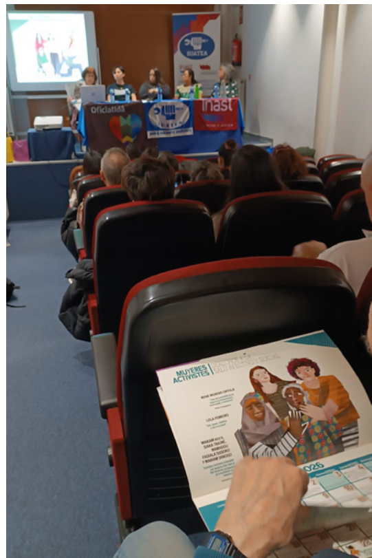
La revista El CLARIÓN, de la O.M. de la Confederación Intersindical dedicada al 8 de Marzo, incluye artículos y actividades educativas .