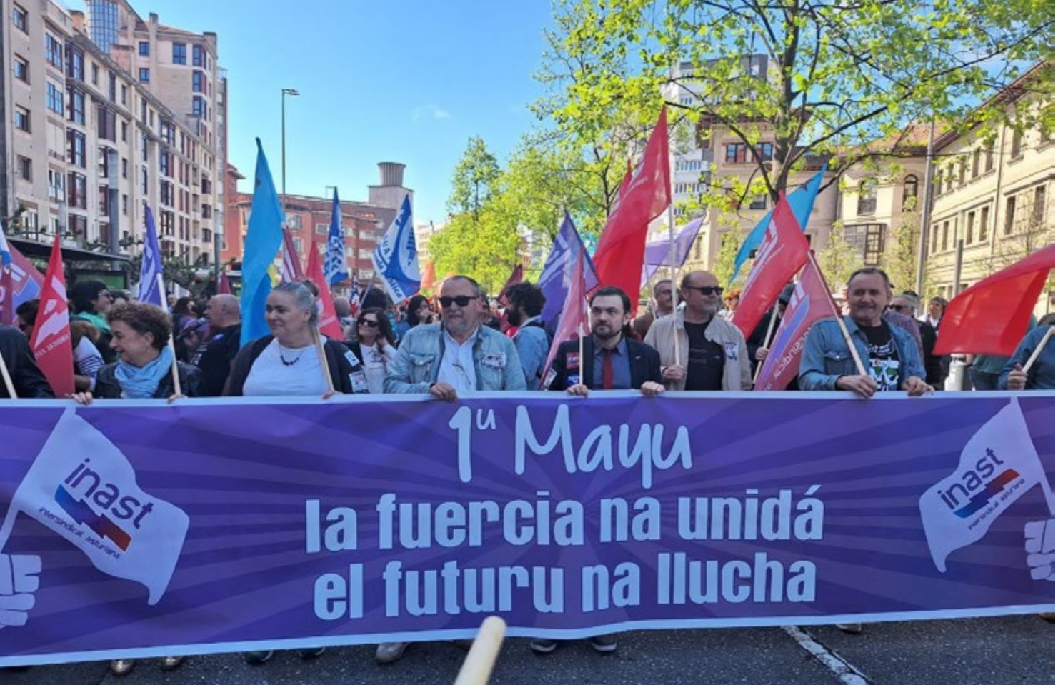
Manifestación del Primeru de Mayu de 2025